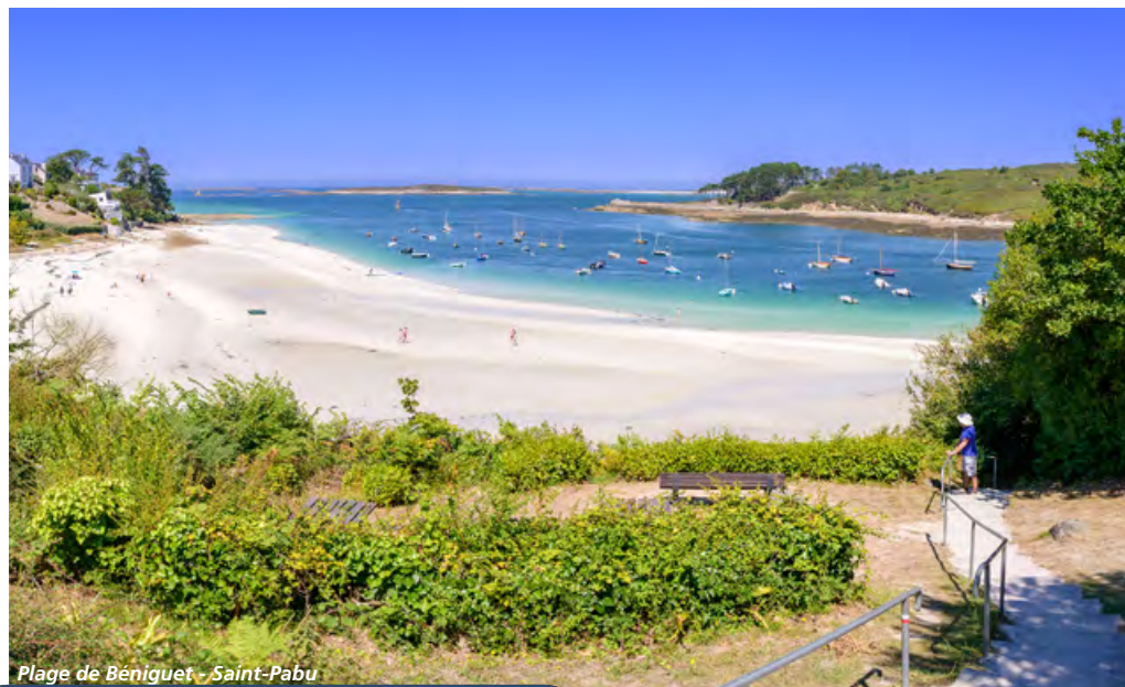
Plage de Beniguet - Saint-Pabu

Cet itinéraire chargé d'histoire et balayé par les embruns est l'une des plus belles façons de découvrir le département.