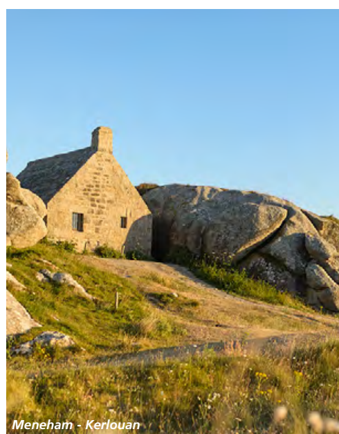
Meneham - Kerlouan

The GR®37 route, across a national reserve The GR®37 goes from the Mont Saint-Michel to the Pointe de Pen-Hir, in Camaret-sur-Mer. You'll hike through the Parc naturel régional d'Armorique and its unique geography with krec'h, a maritime or a mountain atmosphere. On your way, spot the geological treasures on the Presqu'île de Crozon or the Monts d'Arrée.