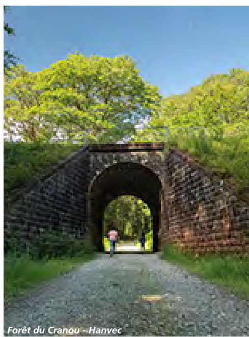
Forêt du Cranou - Hanvec

The hiking starts at the Pointe de Pen-Hir, a high up rocky outcrop in the Presqu'île de Crozon, overlooking the Tas de Pois, those huge rocks that look like dots in the sea. The path then heads towards Landévennec and then goes to Le Faou and the forest of Cranou on the foothills of the Monts d'Arrée. Stop at Saint-Rivoal at the Maison Cornec, a typical house from this region. After a few kilometers, the path reaches the Montagne Saint Michel from where you can see Finistère, moors and bogs, the lake of Brennilis. Find the same natural beauty in Huelgoat before arriving in Carhaix-Plouguer where you'll discover the ruins of the Gallo-Roman city of Vorgium.