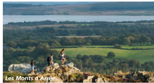
Les Monts d'Arrée