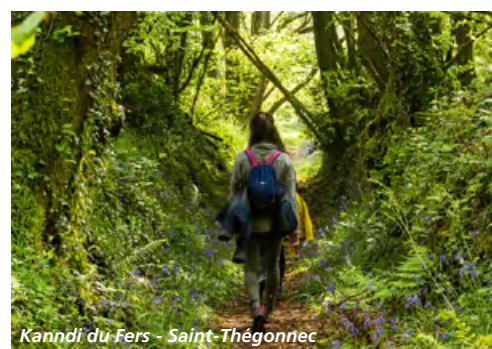
Kanndi du Fers - Saint-Thégonnec

The GR® de Pays Along the 7 GR® de Pays hiking route, you'll discover Finistère and its landscapes full of contrast, meeting local people. In addition to hiking, go in visits, try water sports, go for a swim or simply sunbathe on the sand by a pretty cove. Hiking in Finistère is an unforgettable experience through breathtaking panoramas.