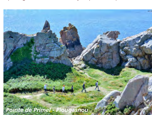
Pointe de Primel - Plougasnou

Itirando.bzh, cliquez, c'est planifié ! Vous y trouverez des outils pour organiser au mieux votre itinérance le long du GR®34 selon votre profil et vos envies.